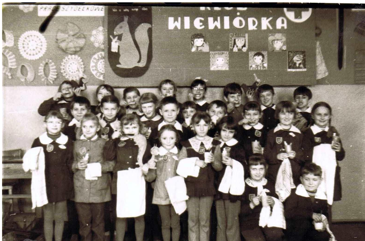
Rysunek 4. Szkolny klub PCK klas młodszych.

W szkole powstało szkolne koło PCK , którego opiekunką została pani Eleonora Musiałek. Koło liczyło 150 członków i prowadziło „następujące sekcje: