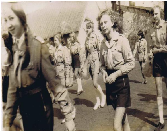
Rysunek 7. Drużyna im. M. Fornalskiej