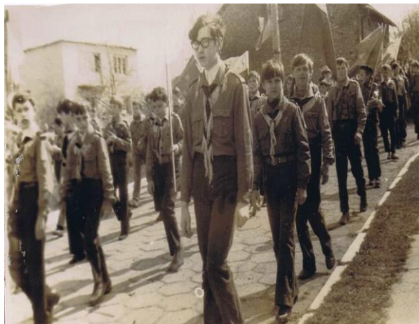
Rysunek 8. Drużyna im. H. Sucharskiego

W ciągu roku szkolnego młodzież spotykała się na wtorkowych apelach – było ich 37 – „uczyły ładu, porządku, dyscypliny i koleżeństwa”. Konkurs pod hasłem „Piękna nasza Polska cała” angażował uczniów klas starszych, dostarczał nie tylko ciekawych informacji o regionach naszego kraju ale także, a może przede wszystkim rozrywki.