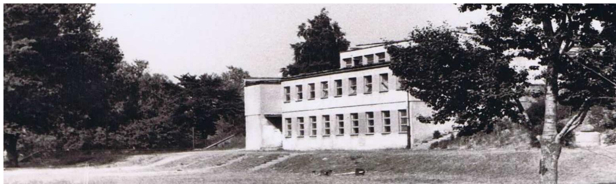
Rysunek 1. Budynek szkoły 1974 rok.

Rok szkolny 1972/1973 wnosi wiele zmian w pracy szkoły: