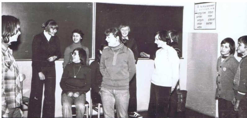
Rysunek 8. Próba kola teatralnego