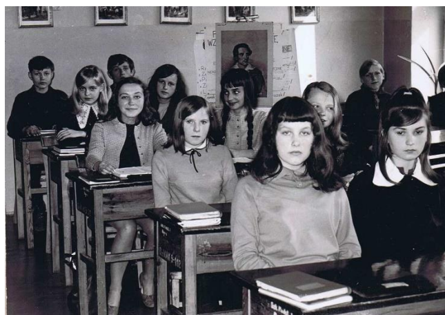
Rysunek 2. Klasa 7b

Do świetlicy szkolnej zapisało się 170 uczniów i „w związku z tym przyznano świetlicy 1 etat pedagogiczny i etat pomocy kuchennej.” Pod kierunkiem Heleny Zakrzewskiej, Krystyny Pandel i nauczycieli pracujących na „dodanym” etacie, uczniowie wykonali dekoracje wnętrza szkoły oraz wiele prac plastycznych.