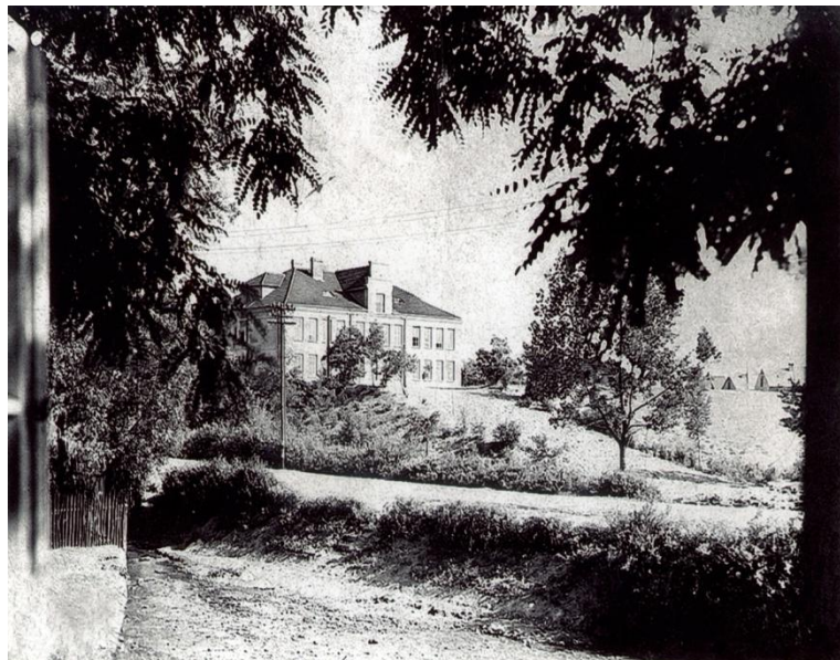
Rysunek 1. Szkoła lata 30-te

We wrześniu 1930, nowa 7-klasowa Publiczna Szkoła Powszechna im. Stefana Żeromskiego w Ogrodzieńcu, powiat olkuski, województwo kieleckie rozpoczęła pracę